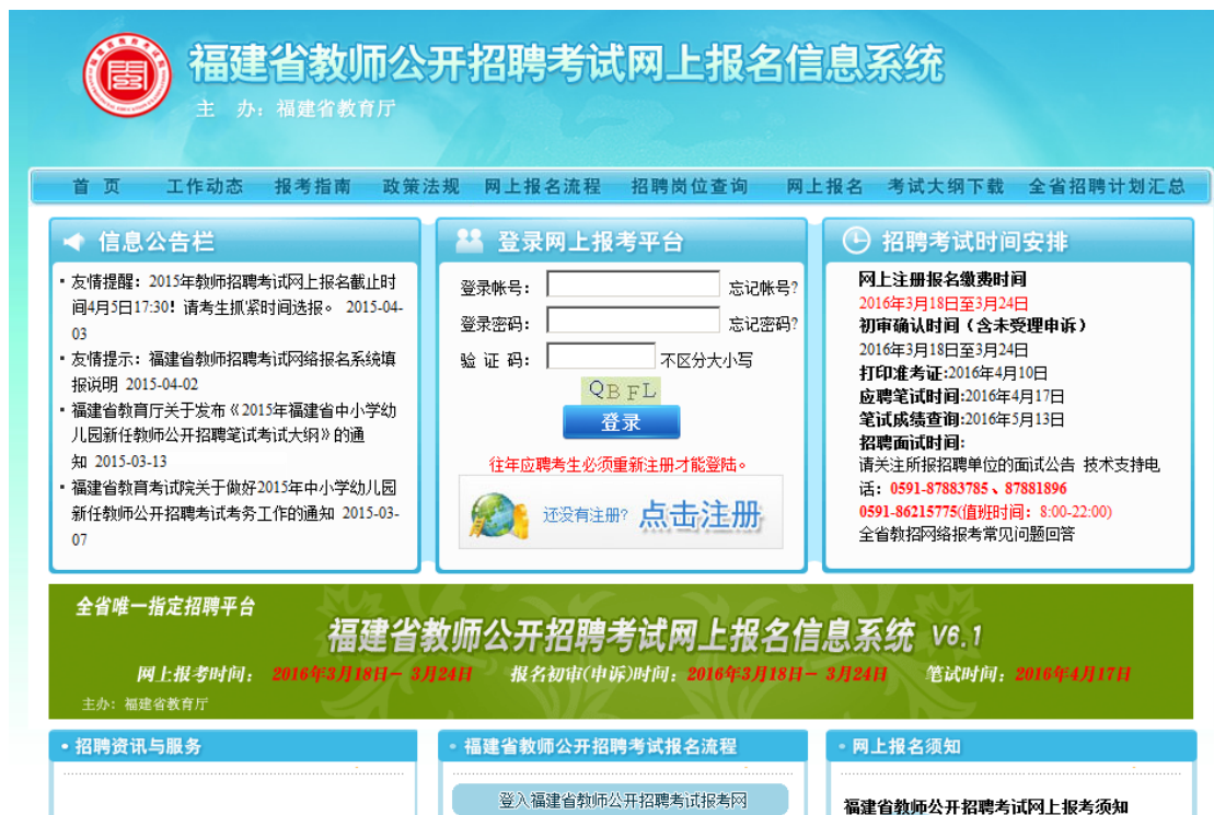
图 1.1.2 “点击注册”图标进入电子身份注册后，即可进入网络报名系统