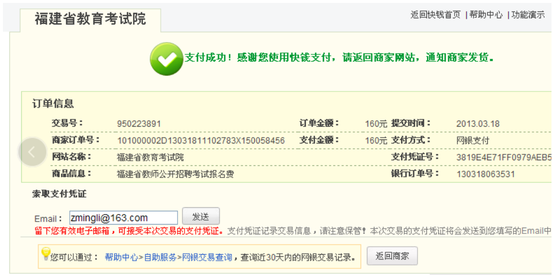
图 2. 2. 15 网上缴费成功提示信息