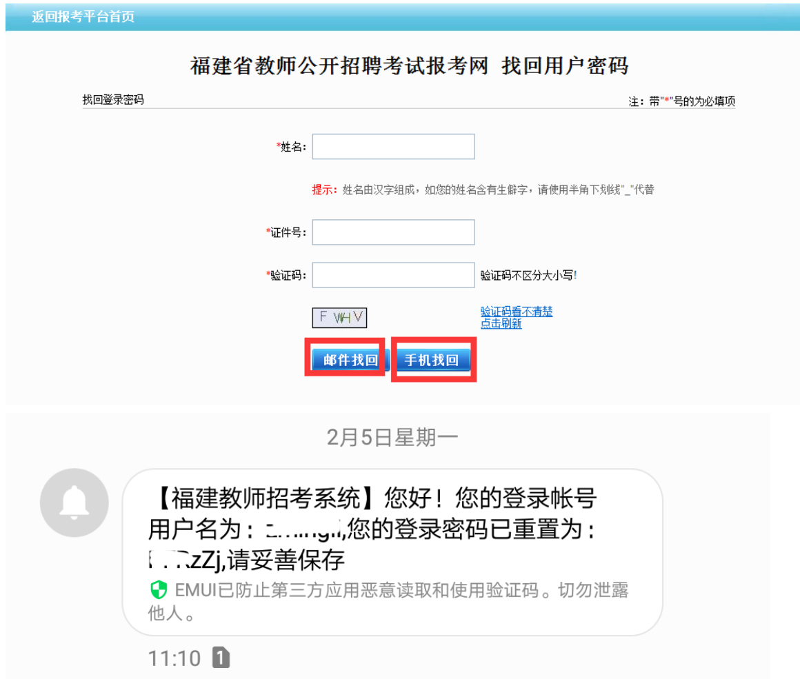
图 1.2.2 手机短信找回

系统提供两种索取方式：[邮件找回]、[手机短信找回]，输入注册时相应的信息后，点击相应的索取方式的一种，进行索回。