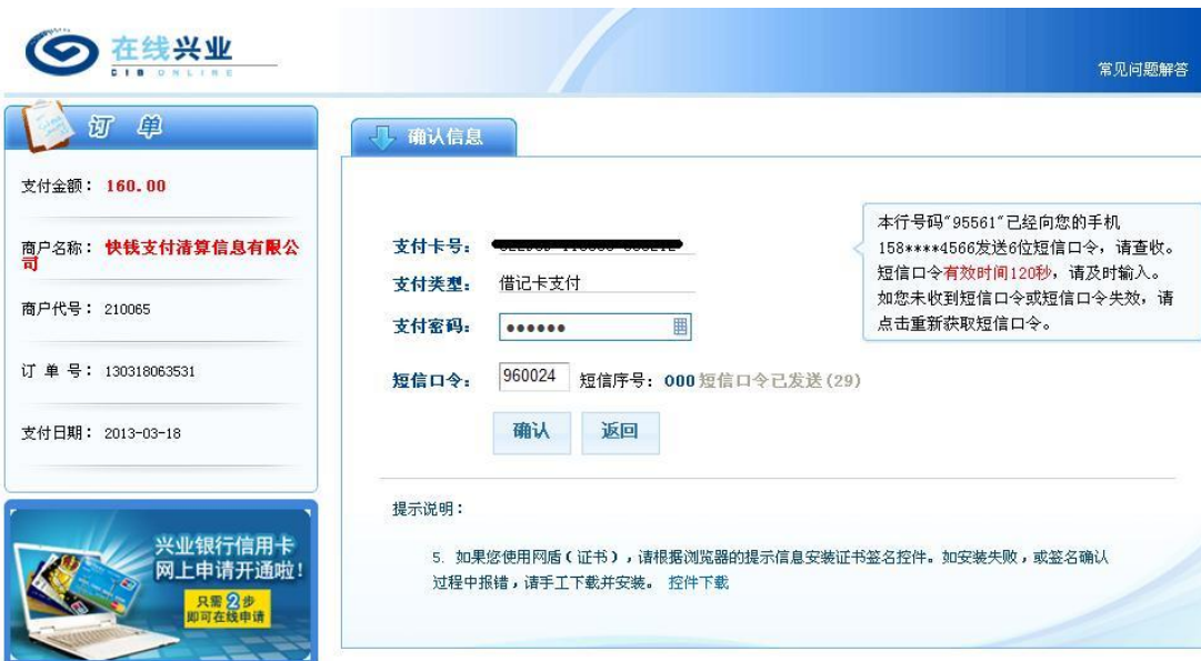
图 2.2.14 进入兴业银行在线缴费界面（输入卡号、支付密码、短信口令）