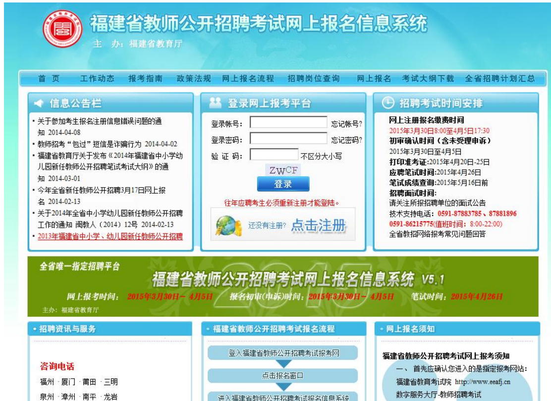
图 3.1.1 应聘考生可以根据网上注册生成的帐号登录“个人报考管理平台”

应聘考生在报名期间登陆报考系统生成注册帐号后，可根据网络报名注册帐号、密码再次进入“个人报考管理平台”。应聘考生可进行 2013 年福建省教师公开招聘考试报名情况的查询，可获取各阶段的重要资讯信息。个人平台功能作用：如 1、应聘考生个人信息查询、应聘岗位信息查询、网上缴费结果查询、招聘单位对应聘者资格初审结果确认信息查询；2、应聘考生对招聘单位初审不符意见反馈信息查询，可进行申诉及补充二次补报岗位；3、在全省网络报名规定时间内补报应聘岗位；4、应聘考生可按规定打印准考证、查询参加笔试时间与地点（考点路线指南）；5、应聘考生留言；6、获取相应的在线资讯及提醒功能信息。