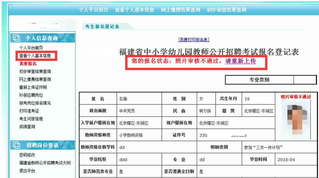
图 2.2.7 查阅相片审核不通过, 可重新上传