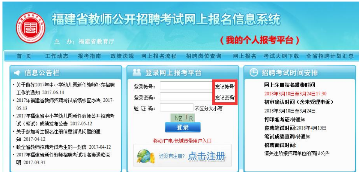
图 1.2.1 报名系统首页

系统提供两种索取方式：[邮件找回]、[手机短信找回]，输入注册时相应的信息后，点击相应的索取方式的一种，进行索回。