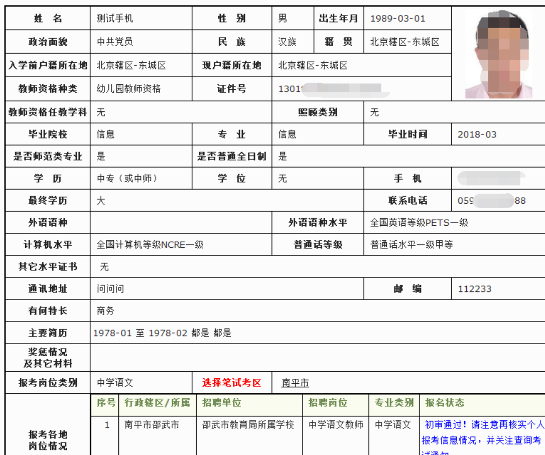
图 3.4.2 应聘考生网上报名报考岗位初审成功后，可打印确认报考初审信息回执单（OK），此时表明应聘考生网上应聘考试报名确认成功。