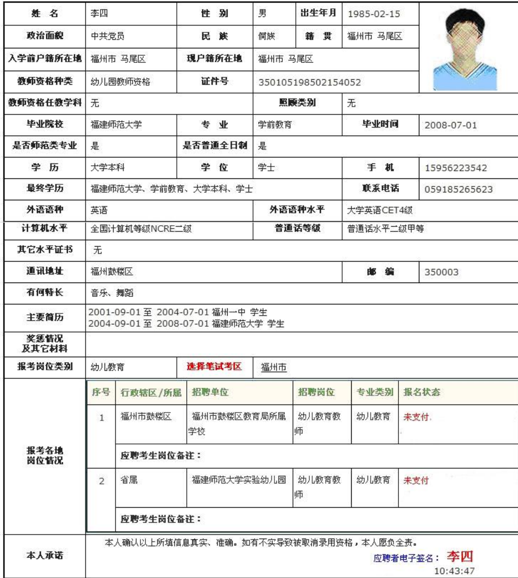
图 2.2.11 应聘考生通过核对个人填写的报考报名信息表，并声明对个人提交的基本信息真实性的保证，即可开始进行网银缴费的操作