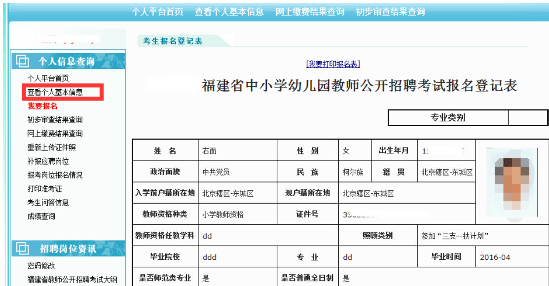
图 2.2.8 查阅相片审核通过