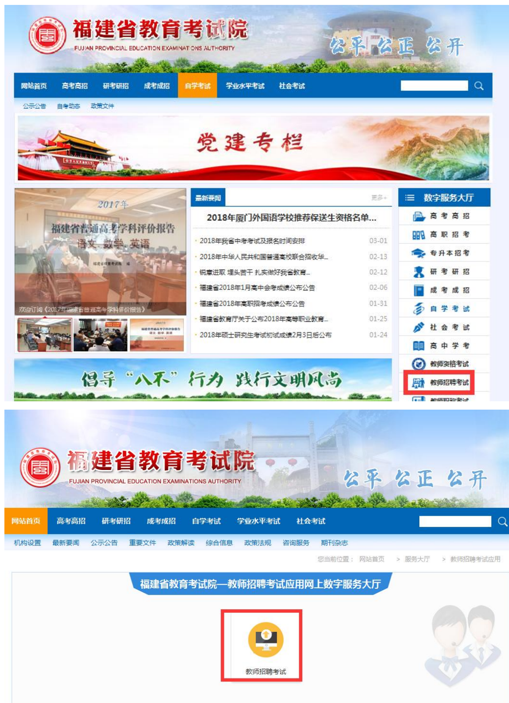
图 1.1.1 登陆福建省教育考试院 www.eeafj.cn 点击“教师招聘考试”图标进入网上报名系统平台

1、登陆“福建省教育考试院 www.eeafj.cn ”——数字服务大厅，点击“教师招聘考试”图标进入网络报名系统平台。