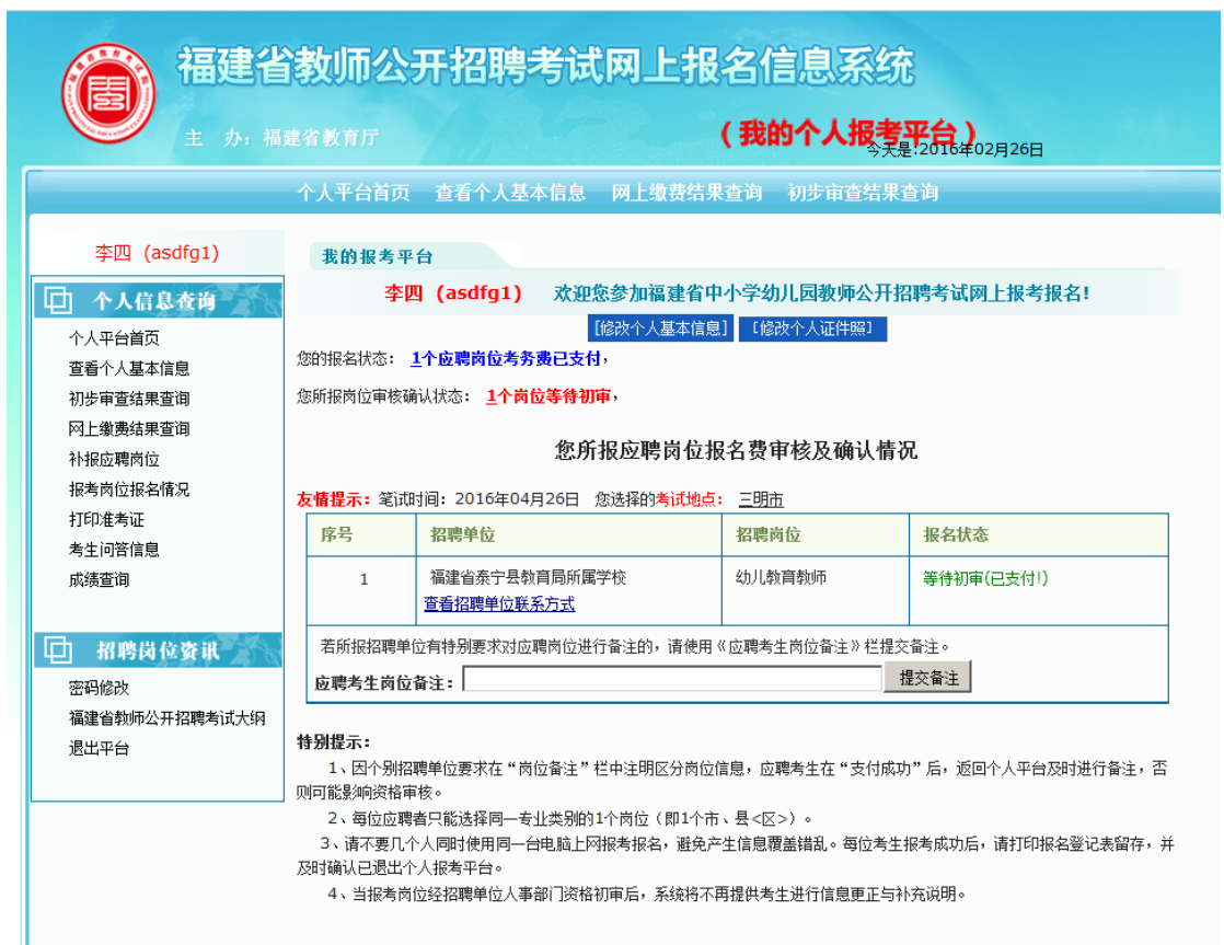
图 2. 2. 12 点击“返回支付网站”后, 系统跳转至应聘考生个人报考平台。

此时应聘考生返回个人信息平台可以查询个人基本信息、网上缴费结果的查询、应聘岗位信息的查询等。当应聘考生在线支付成功后, 应聘考生提交的个人信息不可修改。