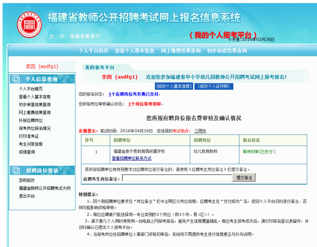
图 3.2.1 应聘者个人报考平台--报名个人信息查询与维护主界面

2、应聘考生登陆个人报考管理平台时，可查询考生个人管理平台主界面报名状态的提示信息：