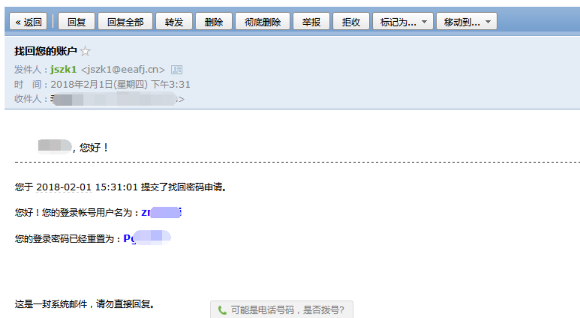
图 1.2.3 邮件找回