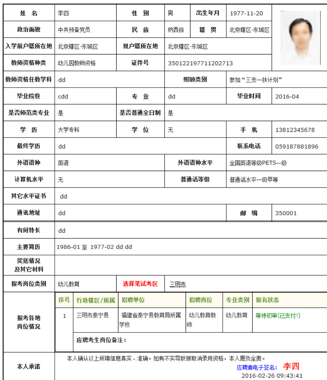
图 2.2.13 查看、打印个人报名信息表