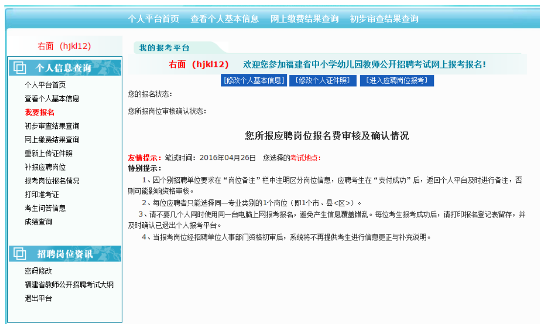
图 2.2.6 考生个人平台